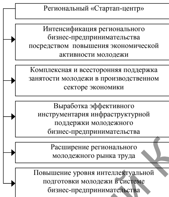
Рисунок 1. Основные целевые ориентиры деятельности регионального «Стартап-центра»

Предметом деятельности «Стартап-центра» является разработка стартап-проектов.