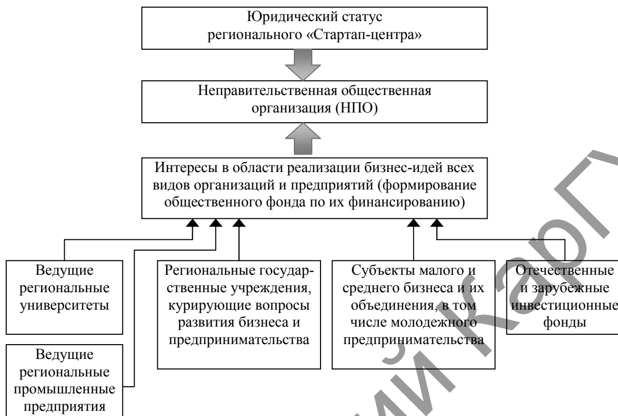
Рисунок 2. Концепция юридических основ функционирования «Стартап-центра»

Финансовой платформой функционирования организационно-хозяйственной деятельности «Стартап-центра» является общественный негосударственный денежный фонд, который формируется за счет взносов заинтересованных организаций в развитии молодежного предпринимательства.