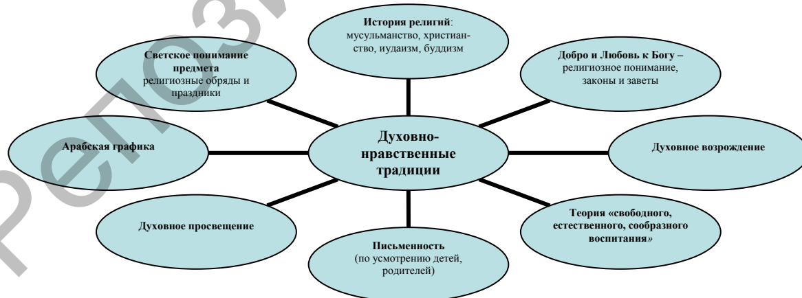
Рисунок 3. Духовно-нравственные традиции как системообразующий элемент поликультурного образовательного процесса

Духовно-нравственные традиции, в том числе религиозные, как содержание образования (см. рис. 3).