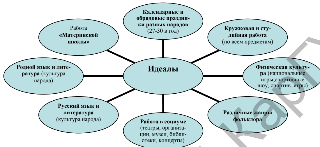
Рисунок 2. Идеал как системообразующий элемент поликультурного образовательного процесса

Приведем несколько примеров. Остановимся на компоненте «Идеал» как содержание образования (см. рис. 2).